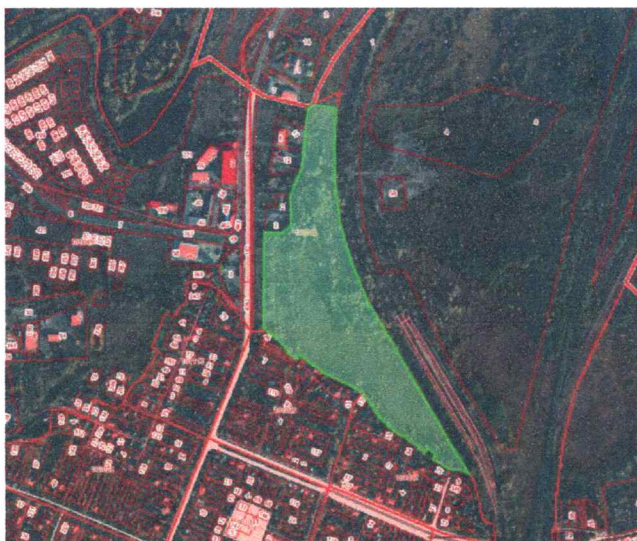
Схема границ незастроенной территории, подлежащей комплексному развитию

УТВЕРЖДЕНА распоряжением Администрации Курской области от 14.12.2022 № 1149-ра