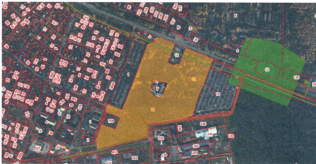
Схема границ незастроенной территории, подлежащей комплексному развитию

УТВЕРЖДЕНА распоряжением Администрации Курской области от 02.11.2022 № 941-ра